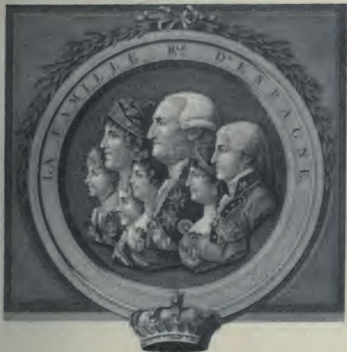
Dessin de R. Cosway, grave par Cardona. (Bibliothèque Nationale. Estampes.)

plupart d'entre elles, dit une note du Moniteur , s'étaient déjà trouvées à des fêtes données par les ministres des relations et de l'intérieur. Mais tel est le goût exquis, dont l'art de plaire semble avoir doué particulièrement les Françaises, que lors même que leur beauté réputée est déjà l'objet d'une sorte de culte public, leur grâce semble chaque jour se développer sous une forme nouvelle. » Un grand banquet termina cette fête, où l'on avait montré aux hôtes du Premier Consul « l'élite des beautés que cette cité